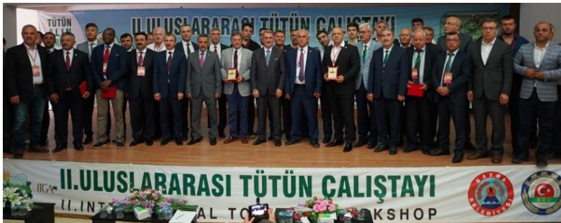
Encontro Regional da ITGA da Turquia, 2019