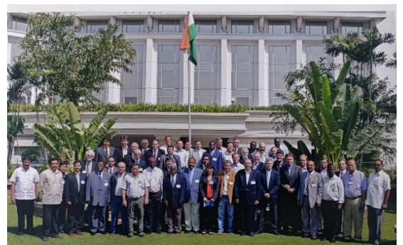
Encontro Anual da ITGA, Índia, 2009