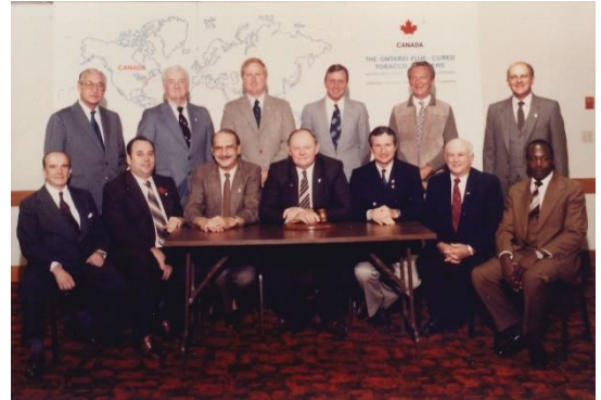
Fundação da ITGA, Canadá, 1984