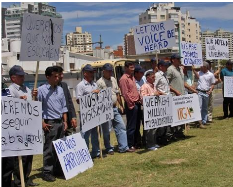
ITGA Produtores de Tabaco na COP4 Uruguai, 2010