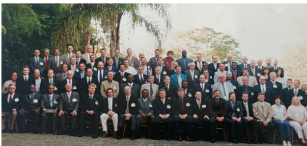
Encontro Anual da ITGA Brasil, 2000