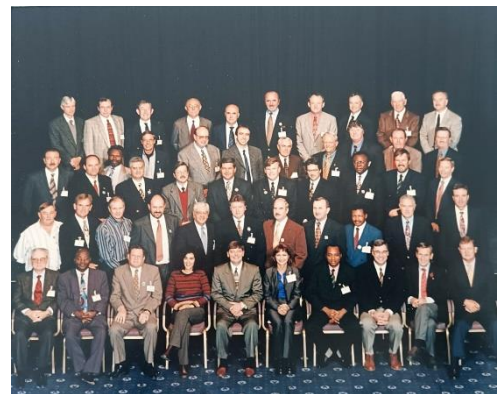
Encontro Anual da ITGA Reino Unido, 1998