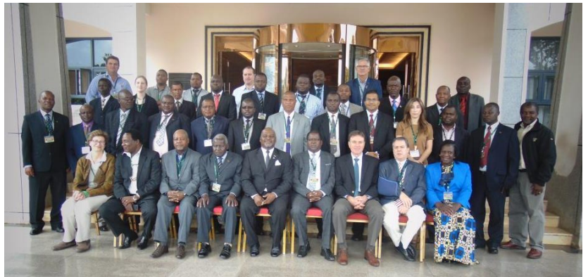
Encontro Regional de África, Zimbabué, 2015