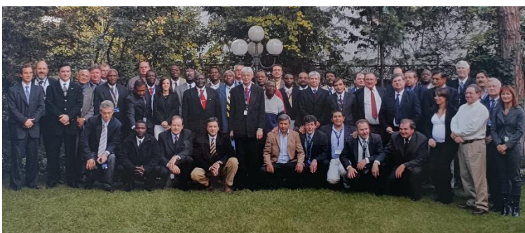
Encontro Anual da ITGA Itália, 2006