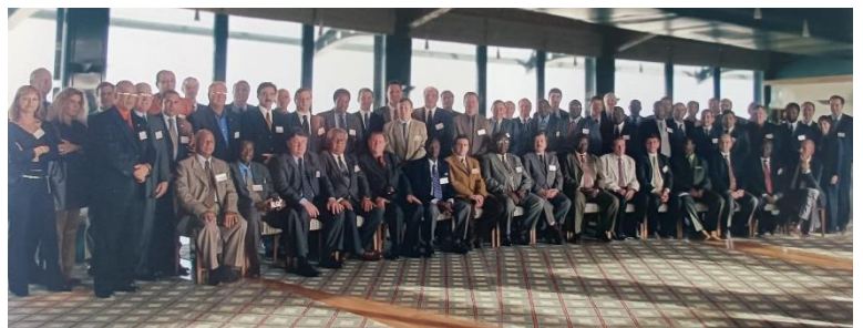
Encontro Anual da ITGA Portugal, 2002