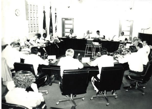
Mesa de Trabalho da Fundação da ITGA, 1984