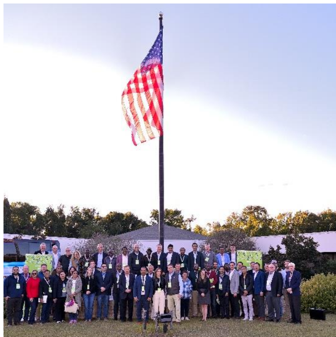
Encontro Anual da ITGA Estados Unidos, 2024