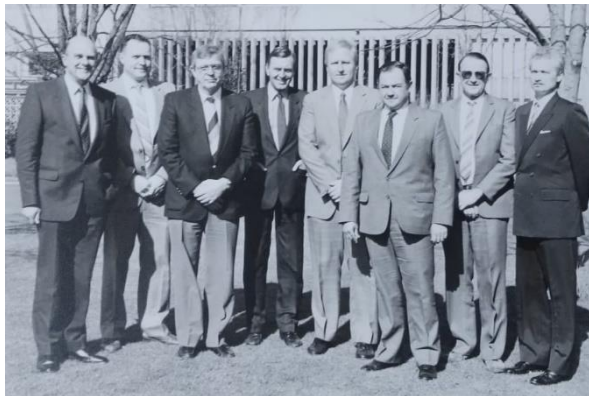
Comité Executivo da ITGA, Reino Unido, 1988