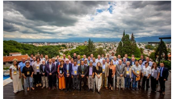
Encontro Regional das Américas, Argentina 2023